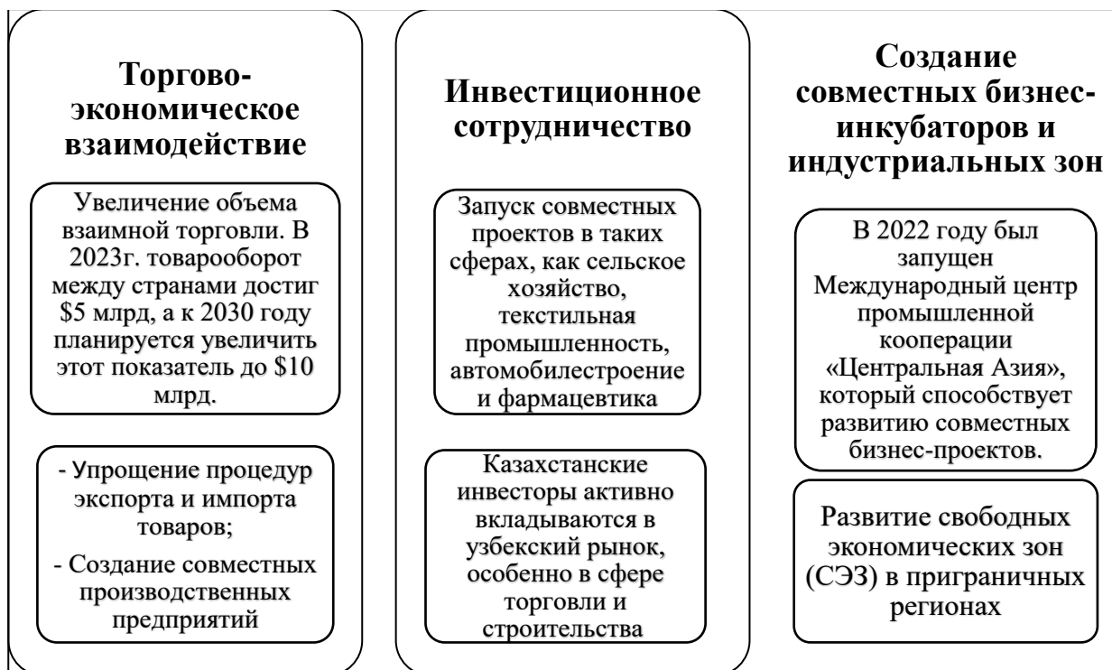
Рисунок 1. Ключевые направления сотрудничества в сфере МСБ Республики Казахстан с Республикой Узбекистан

Успешное функционирование малых предприятий и предпринимательства, как известно, создает благоприятные условия для оздоровления экономики: