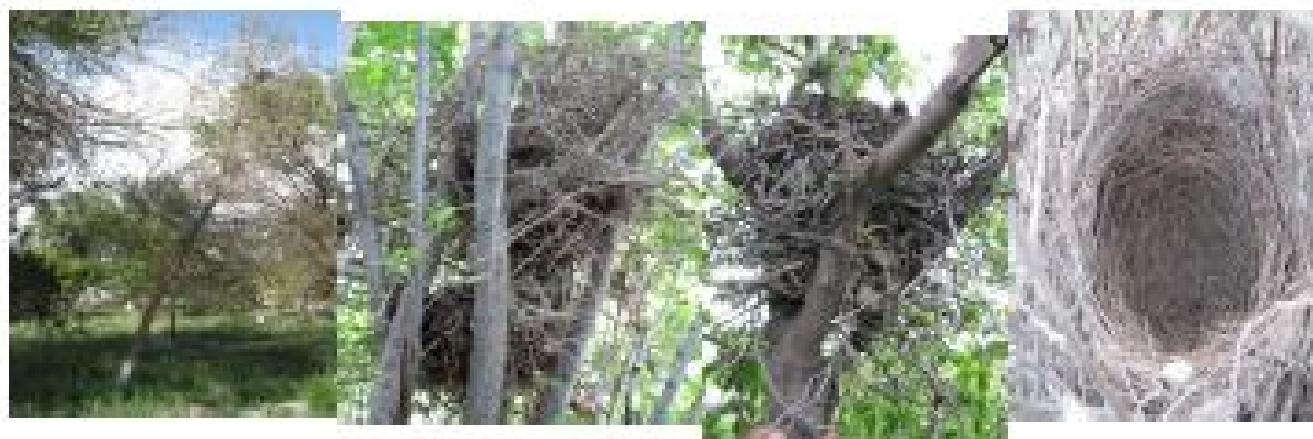
3-rasm. Zag'izg'on uyalari

loydan tashkil topadi. Ayrim uyalarda umuman loy ishlatilmasligini ham ko'rish mumkin. Bu holat uya qurilishining kech boshlanganligi, iqlimning quruq kelganligi bilan tushuntiriladi. Uyaning ichki qismini madaniy va yovvoyi o'simliklarning nafis ildizlari, hayvonlarning junlari bilan to'shaydi. Zag'izg'on uyalari quyida 3-rasmda tasvirlangan