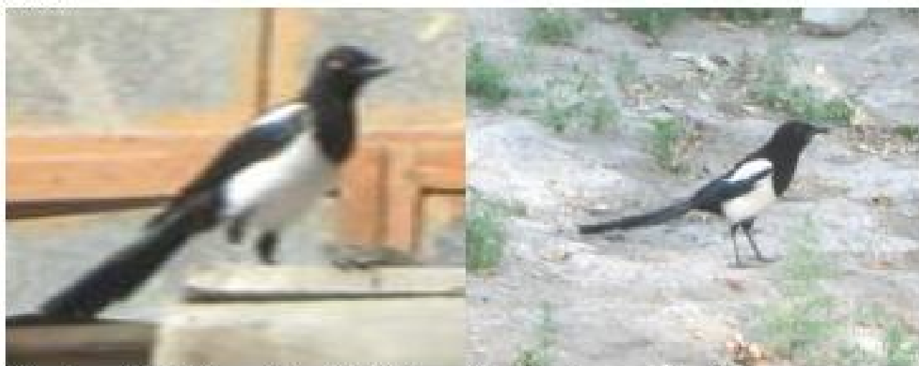
Uyasidan uchub chiqqan bir oylik jo'ja Voyaga yetgan zag'izg'on