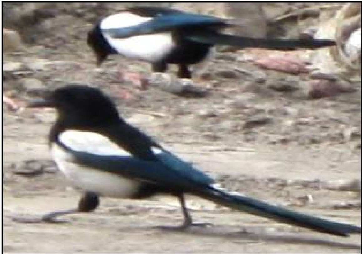
2-rasm. Juft hosil qilgan zag'izg'on

2007-2022 yillar davomida Navoiy va Buxoro viloyatining muhim uchastkalarida, jumladan, Sarmishsoyda, Xatirchi tum., Navbahor tum., eski shahar, bog'lar va ko'kalamzorlar, shahardagi qabristonlarning atroflarida, suv havzalarining bo'ylarida, shahardagi turli ta'lim muassasalarining hovlisidagi va atrofidagi daraxtzorlarda hamda kasalxonalar atrofida kuzatish olib bordik.