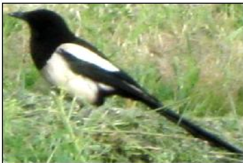
1-rasm. Zag'izg'onning umumiy ko'rinishi

Zag'izg'on o'troq qush bo'lib, uni mamlakatimizning barcha viloyatlarida, shu jumladan, Navoiy va Buxoro viloyatida ham yil davomida uchratish mumkin. Zag'izg'on odamlar orasida bir nechta nomlar (hakka, ola hakka, ola shaq-shaq, qushlarning pandasi) bilan mashhur. Zag'izg'onning boshi, bo'yni, ko'kraging oldingi qismi, tanasining orqa tomoni, dumu, tumshug'i va oyoqlari qora rangda, yelkasi, ko'kraging orqa qismi va qorni oq rangda, dumu esa uzun bo'ladi. Zag'izg'onning umumiy ko'rinishi quyida 1-rasmda tasvirlangan. Navoiy va Buxoro viloyatida zag'izg'onning uya qurishi, ko'payishi, rivojlanishi, umuman olganda barcha hayotiy jarayonlarini amalga oshirishi uchun qulay shart-sharoitlar mavjuddir. Masalan, uya qurishi uchun turli xil balandlikdagi daraxtlarning, xomashyoning mo'lligi, bolalarini boqishi uchun oziqaning serobligi, iqlimiy omillarning qulayligi va boshqalar.