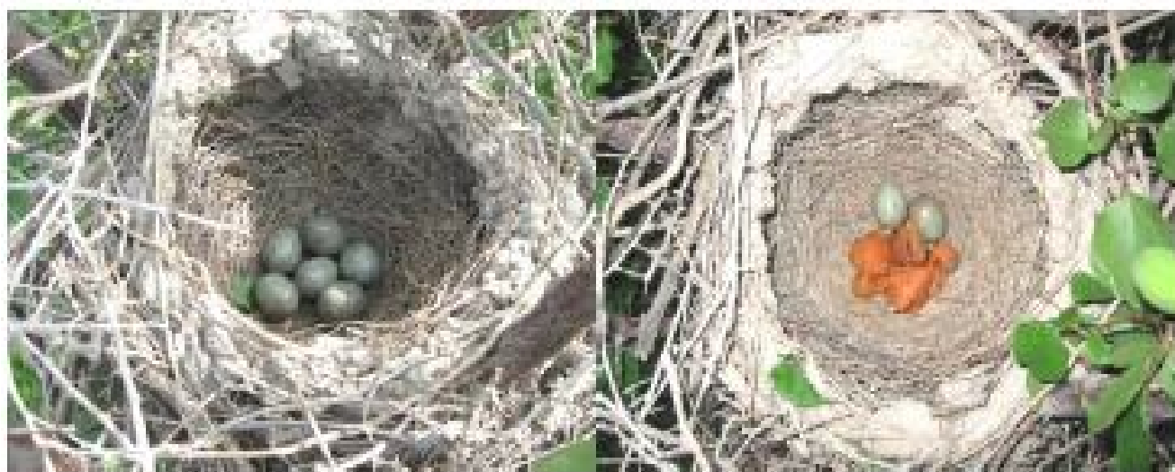
Tuxumlarning uyada joylashishi

kichikligi, rangining xiraligi, gavdasining ko'krak-qorin qismi pat va parlarining to'kilganligi kabi morfologik belgilarga asoslanib ajratish mumkin. Tuxumdan jo'ja chiqish arafasida tuxum massasi kamayadi, po'chog'i chatmaydi. Bu hodisa tuxum ichidagi individning perenatal davrdan postnatal davrga o'tayotganligi bilan aloqador bo'lsa kerak. So'ngra, tuxumlardan quloq teshigi yopiq, ko'zlari ojiz, tanasi patsiz, nimjon va zaif jish jo'jalar chiqadi. Tuxumlardan jo'jalar 2 kunda, odatda 1-kuni 3-4 tasi, 2-kuni qolganlari ochib chiqishadi. Buning sababini tuxumlar uyaga bir kunda qo'yilmaganligi bilan izohlash mumkin. Yangi ochib chiqqan jo'jalarning ( n=8 ) og'irligi 6,3-9,8 gramm bo'ladi. Rivojlanishning 5-kuni quloq teshiklari, 6-kuni ko'zlari ochiladi. Jo'jalar bir haftalik bo'lganda pat va parlarning rivojlanganligini kuzatish mumkin. Jo'jalar 10-12 kunlik bo'lganda rangi to'qlashib, tashqi qiyofasi, hatti-harakati ota-onasiga o'xshab boradi. Tuxumdan jiqqan jo'jalar 27 kundan so'ng uyasidan uchib chiqadi. Zag'izg'onning ko'payish sikli quyidagi 4-rasmda keltirilgan