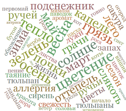
Рис.8. Скриншот-пример представления ассоциативного ряда (облако ассоциаций) к концепту весна в русском языке в онлайн-проекте Sociation.org

Весна в восприятии городских жителей XXI века, особенно для жителей мегаполиса, в отличие от их предков – древнерусских крестьян-землепашцев и ремесленников, уже не является периодом, предвещающим наступления тепла, обуславливающего появление съедобной зелени, которая позволяла расширить скудный зимний рацион запасенных продуктов, медленно, но верно заканчивающийся к началу весны. Исторические события, образ жизни, мышление, технологизация и цифровизация общества обусловили значительную разницу в мировосприятии поколений. Однако среди неизменных факторов восприятия весны древнего и современного носителя русского языка можно назвать положительные эмоции, выражающиеся в словах с эмоционально-положительным значением. Так, словарь онлайн-проекта Sociation.org ( https://sociation.org/ ) насчитывает 327 слов-ассоциаций, представляющие когнитивные признаки концепта «Весна», среди которых очевидно преобладают ассоциации с положительной оценкой.