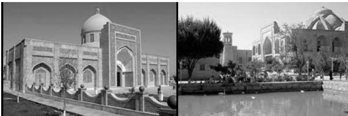
Рисунок 1. Мемориальный комплекс Накибанди (вид с наружи)

Мавзолей святого Бахоуддина Накшбанда считается среднеазиатской Меккой. Сюда приезжают верующие из разных мусульманских стран, чтобы попросить исполнения желаний и отвращения грехов. Считается, что молитвы из святого места до Аллаха доходят лучше всего... А три пешехода из Бухары до некрополя «засчитываются» как один хадж.