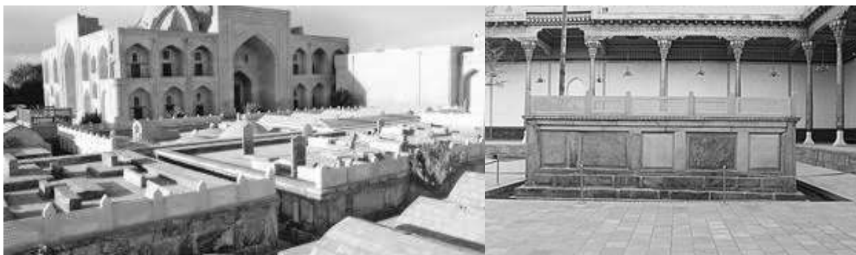
Рисунок 2. Мемориальный комплекс Накибанди (могила Бахауддина Накибанди)

Слово Накшбанд, состоит из двух слов «Накш» - узор, «Банд» - связывать, вместе звучит, как Связывающий узоры. История: Бахауддин Накшбанд родился в марте 1318 года в семье ремесленника в деревне Касри-Арифон около Бухары (Узбекистан). Как и его отец Бахауддин владел ремеслом ткача. А также он был гравировщиком.