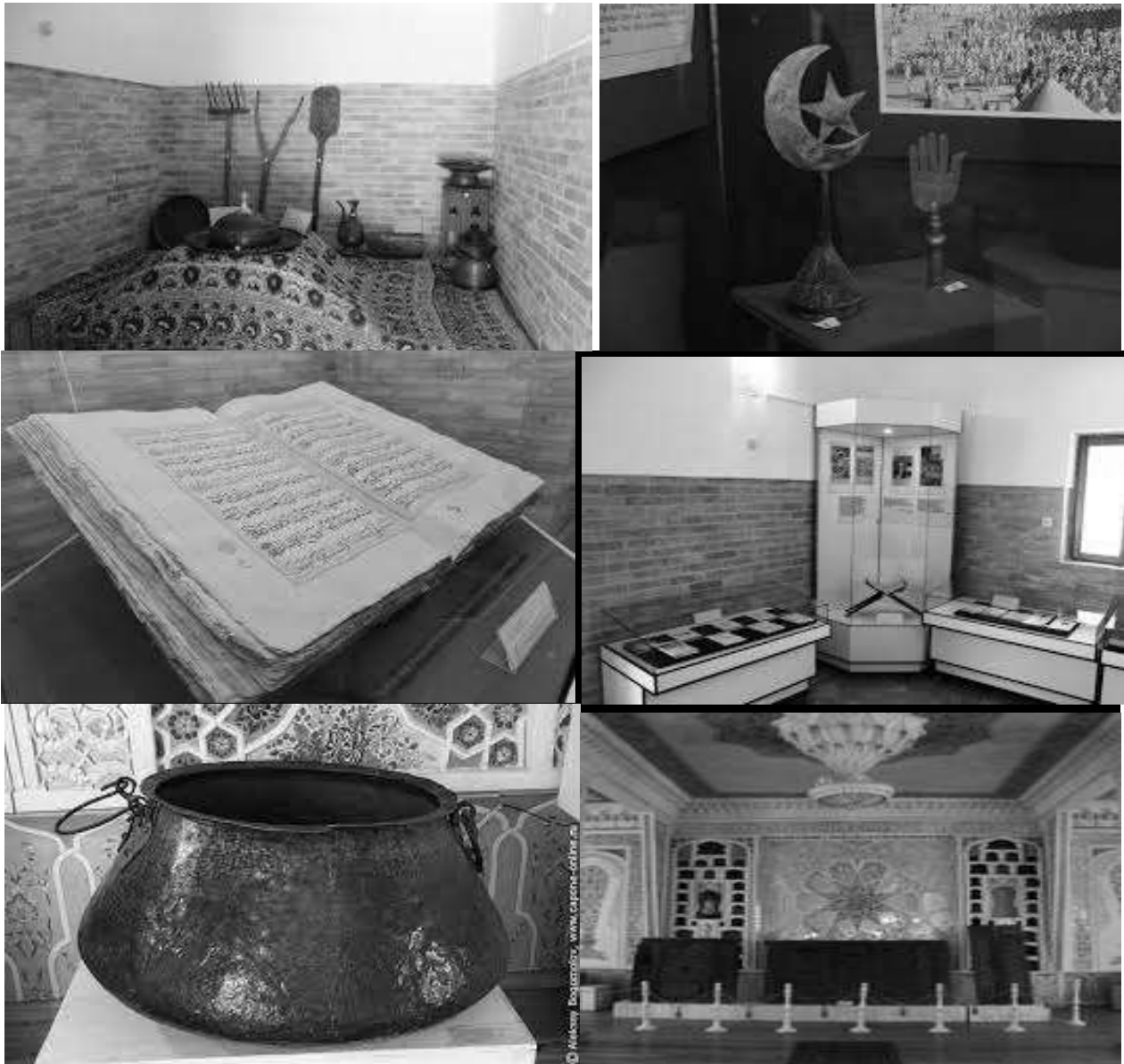
Рисунок 3. Мемориальный комплекс Накибанди (музей Бахауддина Накибанди)

Легенды Бахауддина: В центре комплекса Бахауддина Накшбанди, рядом с прудом, лежит старая повядшая шелковица которая, по преданию, выросла из посоха Бахауддина (Рис 4). По легенде, бытует