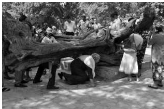
Рисунок 4. Старая повядшая шелковица (рядом с прудом Бахауддина Накибанди)

мнение, что если загадать желание и пролезть под ней, или же обойти вокруг этого дерева три раза, то ваше желание непременно сбудется.