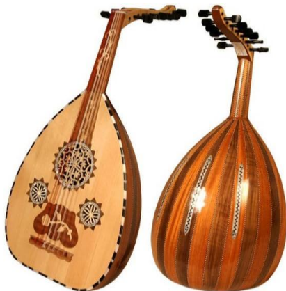
1-rasm. Ud yoki Borbat - musiqa asbobi

Abu Abdulloh Rudakiyning she’rlarida “nag’mai kuan”, “lahnaki g’arib”, “bongi zer” yo “bongi nolai zer”, “chang bargiriftanu navoxtan va surud andoxtan”, “ro’d zadani mutrib”, “ovozi xub”, “surudgo’yon hazordaston budan”, “xuro’shi barbat”, “latifdastii changgavozon”, “bo nayu bo ro’d”, “ba yak dast chang pesh omadan”, “ba savti navo”, “barbati Isovuh lahnhoi Fuodā”, “changi Mudakniru noyi Chobuki Hobon”, “samo’”, “solu mahu go’sh ba ro’du surud doshtan”, “ridakoni mutrib”, “ba sarv shohro’d barovardani foxta”, “ba tanbo’r zaxma furu hishtani zandvof”, “bongi ro’d shunidan”, “xunyogari nag’z”, “ba chang chang giriftan”, “ba shast changro navoxtan” qo’llanilishi uning kasbiy musiqa ilmidan xabardorligidan dalolat beradi.