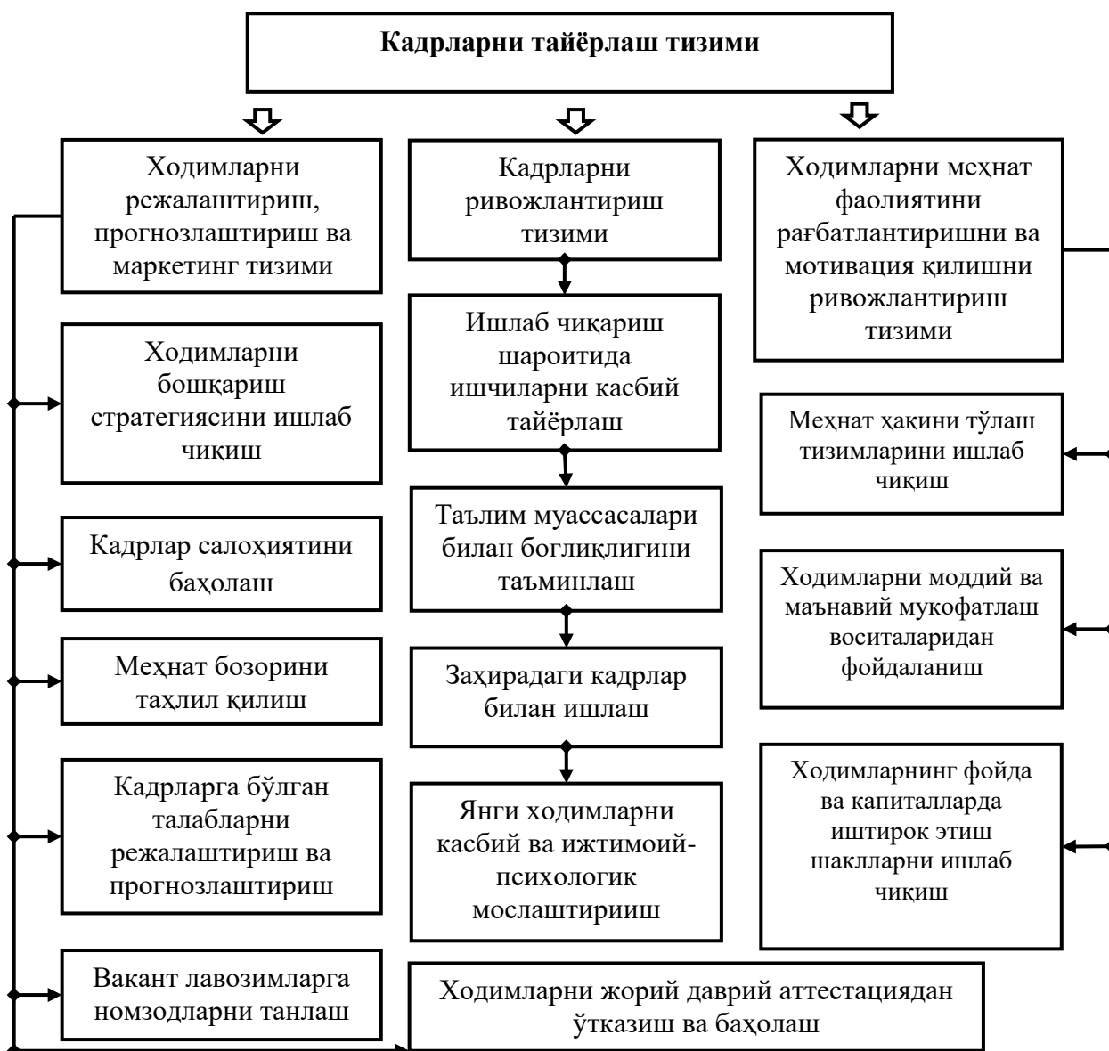
2-расм. Кадрларни тайёрлаш хизмати тизимаси 3

Кадрлар тайёрлаш хизмати бошқа нарсалар қатори ҳақ тўлашдаги ўзгаришлар орқали ўз малакасини оширувчи ходимларни ҳам маънавий, ҳам моддий рағбатлантириш вазифаларини ҳал этади. Меҳнатга ҳақ тўлаш – бозор механизмнинг энг муҳим таркибий қисми бўлиб, ходимнинг меҳнат ресурсига эгалик ҳуқуқини иқтисодий рўёбга чиқариш шаклидир. Ҳозирги мавжуд вазиятдаёса ходимнинг меҳнат фаолиятини оширишда унинг ўрнини баҳолаш қийин. Шу боисдан қишлоқ хўжалиги кооперативларида ҳақ тўлаш тизимини таҳлил қилингандан кейин қуйидаги хулосалар чиқарилди: